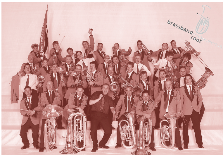
Ausgelassene Stimmung auf dem Foto der Brass Band Musikgesellschaft Root aus dem Jahre 2005.

Welches Werk spielen die Mitglieder am liebsten?