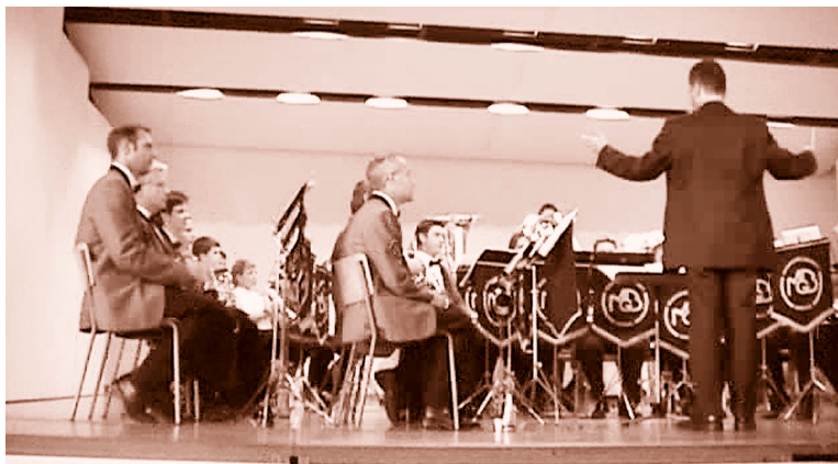
Dieses Foto wurde anlässlich des Frühschoppenkonzertes 2004 aufgenommen.

Welches Erlebnis darf als das Schönste bezeichnet werden?