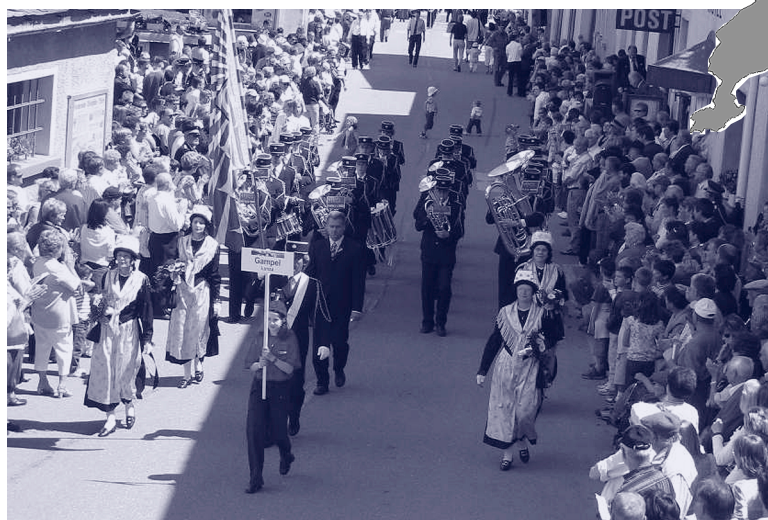
Die Musikgesellschaft Lonza am Oberwalliser Musikfest in Simplondorf.

Wünschen wir unseren Walliser Freunden zum neuen Jahr ein paar neue Mitglieder – Blech oder Holz!