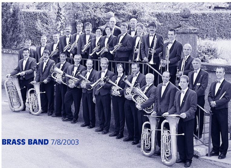
BRASS BAND 7/8/2003